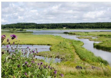
Utsikt från Svalnäs.