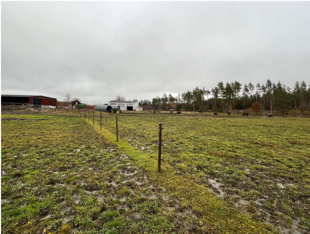
Bild: Marken där våtmarken är tänkt att grävas ur, är idag en blöt åkermark.