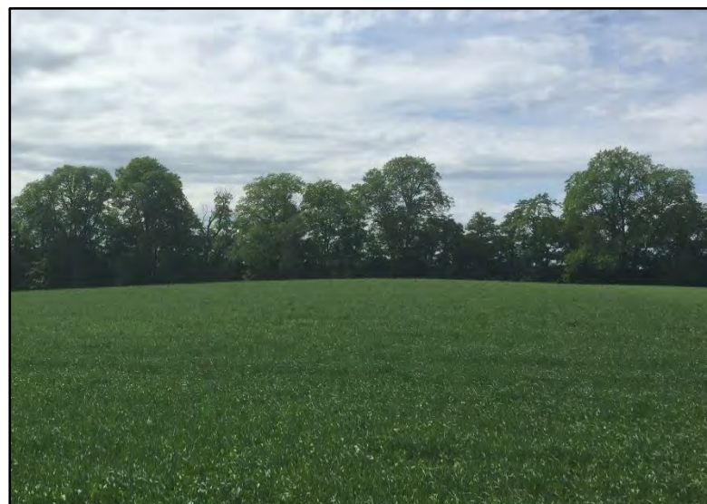
Det smalare partiet söder om gården Stora Foxarne hyser flera gamla o grova ädellövträd som höjer sig över ett längre och tätt skikt av björk och klibbal.

Ädellövträden i kanten mot åker- och betesmark ska ha goda förutsättningar att fortleva och utvecklas.