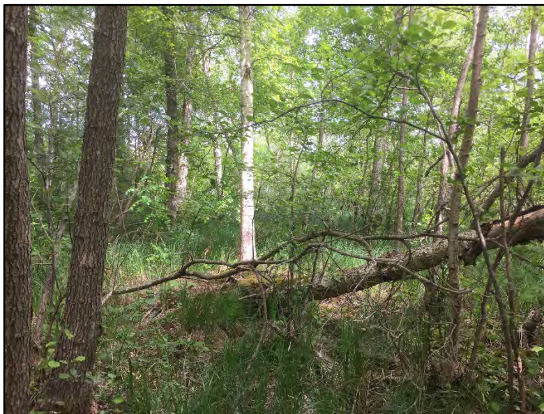
Skogen består till största delen av medelålders björk/klibbalskog.

Ett långt parti av omväxlande smal och bredare strandskog längs med Skärvalångens och Eggbysjöns stränder. Trädskiktet består främst av ung – medelålders klibbal och björk men här finns också partier som är rika på gamla och grövre ädellövträd. Särskilt sträckan från gården Stora Foxarne i norr till fastigheten Sjögård 1:1 (storskötselområde 13) i söder hyser många gamla ädellövträd. Skogen kantas i norr av öppen åkermark vilket gör skötselområdet till en mycket lång syd- och västvärd brynmiljö som utgör en mycket viktig transportled och födosöksmiljö för många insekter och fåglar. Närmast stranden växer ofta gråvidebuskage.