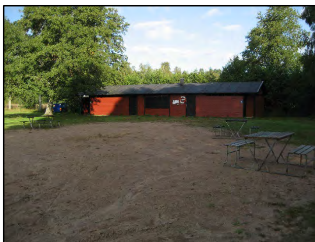
En av de två servicebyggnaderna.