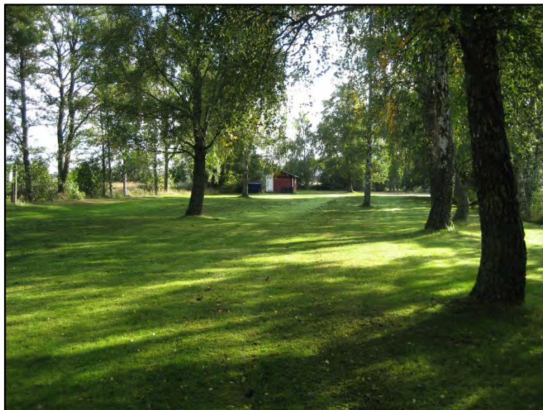
Marken består till stor del av klippt gräsmatta.

Området bör även fortsättningsvis skötas så att bevarandemålet uppnås. Eventuella döda träd kan avlägsnas så att de inte utgör fara för badgästerna.