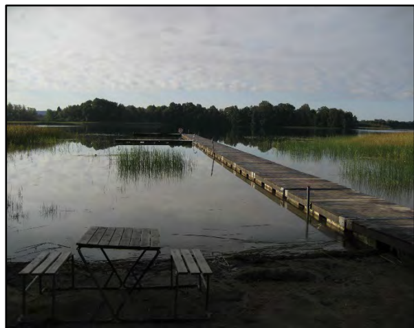
Här finns en badbrygga.