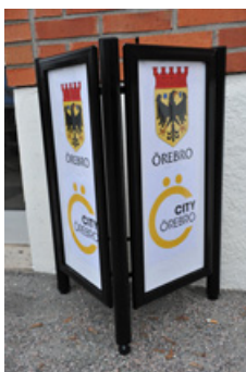
Bild på tillåten reklamskylt