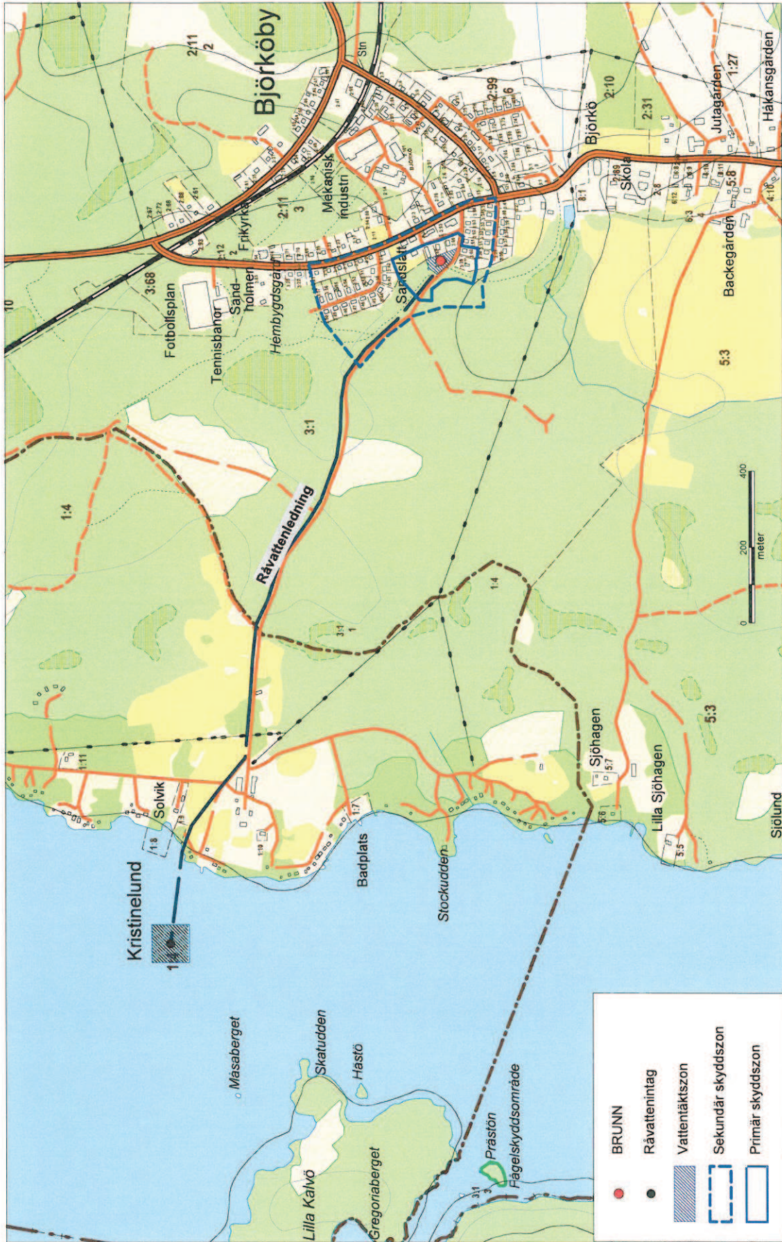
Översikt layout. WOR