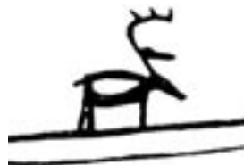
Avbildningar från ceremonitrumma från Vapsten, som nu finns på British Museum i London.