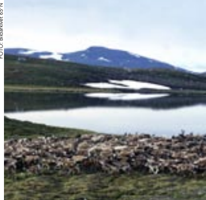
Renar vid Södra Storfjället.