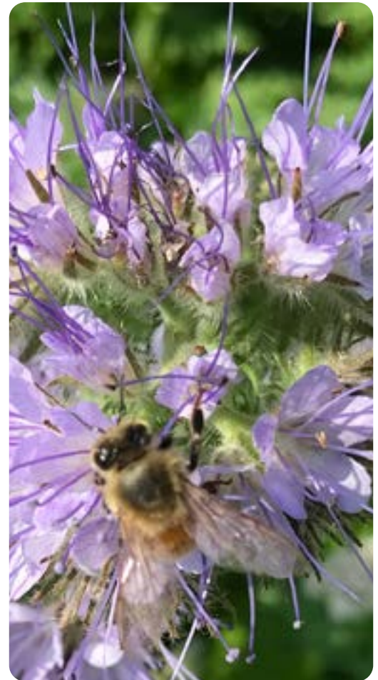
▲ Honungsbi samlar nektar och pollinerar på honungsfacelia.

Du ska tänka på att det du sår inte får användas som livsmedel eller foder, men du får slå av det. Avslagning är inget krav, men rekommenderas om du har en flerårig träda. Det underlättar ogräsbekämpning och kan också gynna blomningen. Ett tips är att inte slå hela trädan på en gång, utan ta en del i taget. Då försvinner inte alla blommor på en gång och de vilda djuren kan fortfarande få skydd under tiden den avslagna delen växer upp igen.