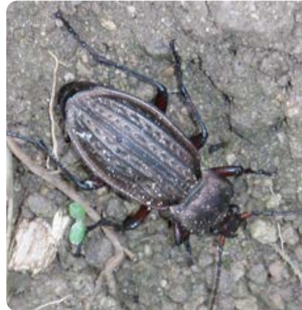
▲ Stor jordlöpare från lähäck – äter 10-15 gram skadedjur per natt.

▼ Ju fler växtarter, blommor, bär och frön som finns i lähäcken, desto fler nyttodjur kan leva här.