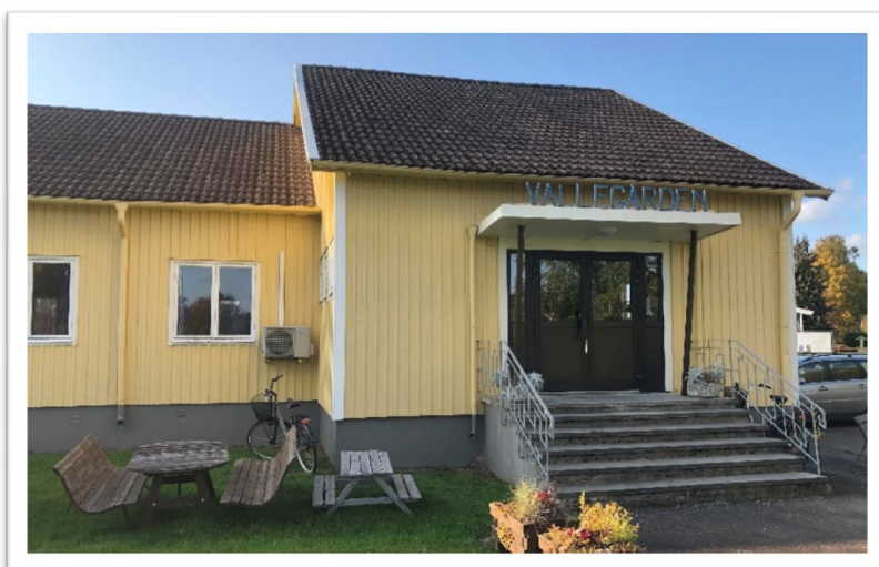
Vallegården i Eggby var denna gång platsen för mötet.

Fokus på mötet var alléer o vägnära träd. Trafikverket har i en skrivelse till Länsstyrelsens redogjort för problemen med att många träd nära vägar, både i alléer och andra miljöer, är döda/döende och riskerar att falla m.m. På mötet diskuterade gruppen hur man på ett bra sätt hanterar situationen och hur vi kan arbeta med att anlägga nya alléer m.m. (kompensationsåtgärder) i Valleområdet.