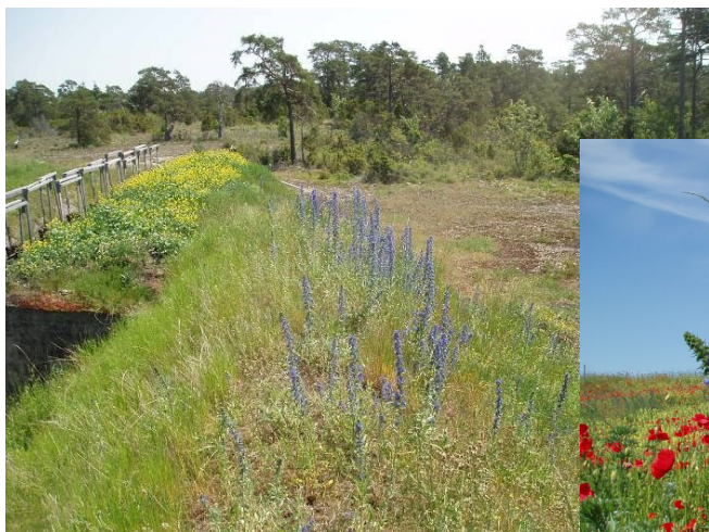
Typiska lokaler för svartpälsbi.

Svartpälsbi trivs i torra och varma, blomrika marker. Man hittar den på sandiga-grusiga och exponerade platser i åker- och ängslandskap och ruderatmiljöer. Ofta hittar man arten t.ex. i körvägar, skjutbanor, motorbanor eller blomrika, ohävdade slänter och sluttningar i stadsmiljö. Svartpälsbiet kan ses flyga maj-juli. Den söker gärna efter nektar i blommor av t.ex. blåeld, oxtunga, fältvedel och getväppling. Boet bygger den genom att gräva hål i marken. Troligen övervintrar den som ung, fullvuxen individ i det bo som dess mor byggde. Arten producerar en kull avkomma varje år.