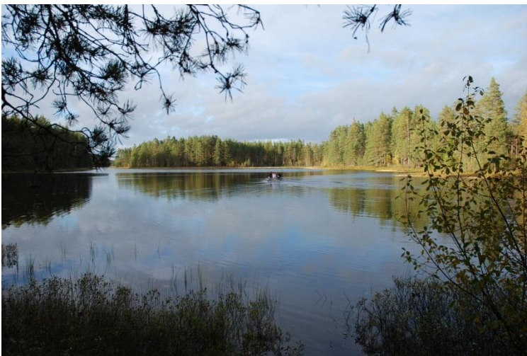
Bild: Södra Siksjön sedd från söder