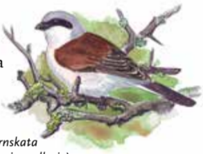
Törnskata ( Lanius collurio ).

Fåglarna följer landskapet. I de öppna spåren som präglar stora delar av Kinnekulle trivs fågelarter som törnskata, göktytta, hämpling och gulsparrv.