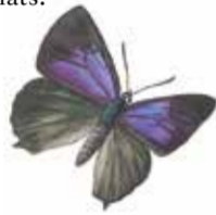
Eksnabbvinge ( Favonius quercus ).

... och för dig som står på toppen av berget och undrar hur högt du är kan vi avslöja följande. Du befinner dig 263 meter över Vänerens yta, men hela 307 meter över havet. Du bjuds alldeles oavsett räknasätt på en vacker vy över landskapet.