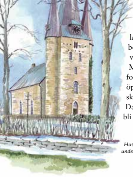
Husaby kyrka. Byggt i sandsten under 1100-talet.

Några hundra år senare – under 1600-, 1700- och 1800-talen – blomstrade herrgårdskulturen på Kinnekulle. På västsidan ligger ännu ett pärlband av ståtliga gods och herrgårdar: Hönsäter, Hellekis, Råbäck, Trolmen, Hjelmäter och Blomberg.