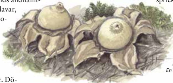
Kragjordsstjärna ( Geastrum triplex ). En sällsam och sällsynt svamp.

Död ved är en bristvara i svenska skogar. Döden är nämligen bränsle för livet. Utan död finns inget liv – och därför kommer du att se träd som ligger ner och förmultnar i markerna. Det är inte försommelse. Tvärtom. Det är omvårdnad.