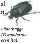
Läderbagge ( Osmoderma eremita ).

Men skulle du springa på en läderbagge i en gammal ek ska du inte försöka sticka fram näsan. Den lilla skalbaggen doftar nämligen läder. Eller kanske torkade plommon, som en del påstår.