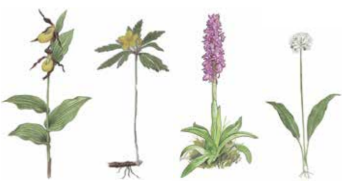
Fyra av bergets vackra blommor. Från vänster: guckusko ( Cypripedium calceolus ), gulsippa ( Anemone ranunculoides ), Sankt Pers nycklar ( Orchis mascula ) och ramslök ( Allium ursinum ).

Men vi nöjer oss så. Vi nöjer oss med att hälsa dig välkommen till det blommande berget.