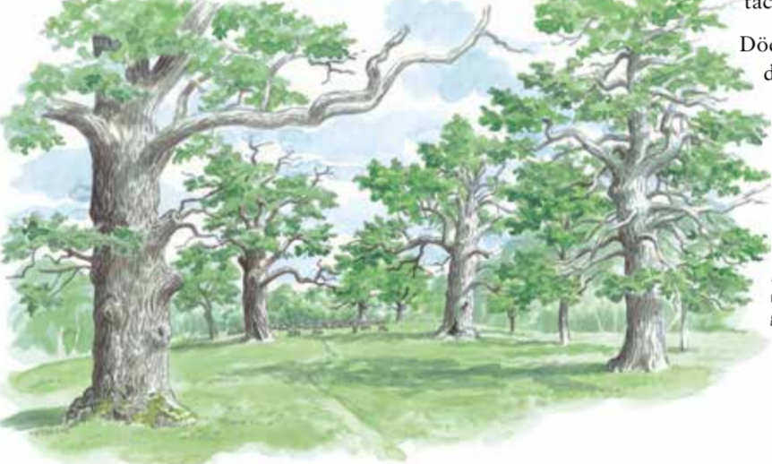
Kinnekulles västsidan är ett av Europas mest värdefulla områden för ekar som hunnit bli gamla och grova.

Vi rekommenderar en vandring vid Västerplana storäng, Blomberg, Djurgården, Gamleriket eller Råbäckskhagar.