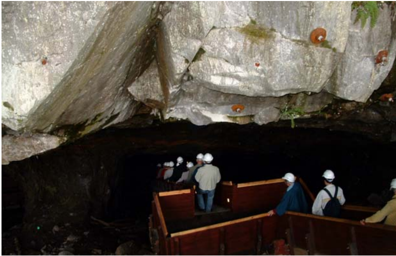
Lockgruvan är tillgänglig för besökare.