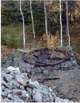
Resterna av ett våndrott, platsen där stånggången ändrade riktning.

Människor nyttjar och påverkar naturen. Landskapet förändras ständigt.