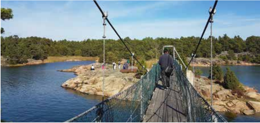
Tillsammans kan vi bygga broar mellan människor!