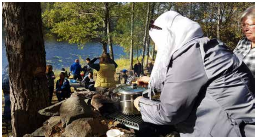
Mattlagning som föreningar.

När vi skiljs åt på parkeringen säger en av studenterna: ”Nästa sommar ska jag åka ut till Stendörren och fiska med mina barn”.