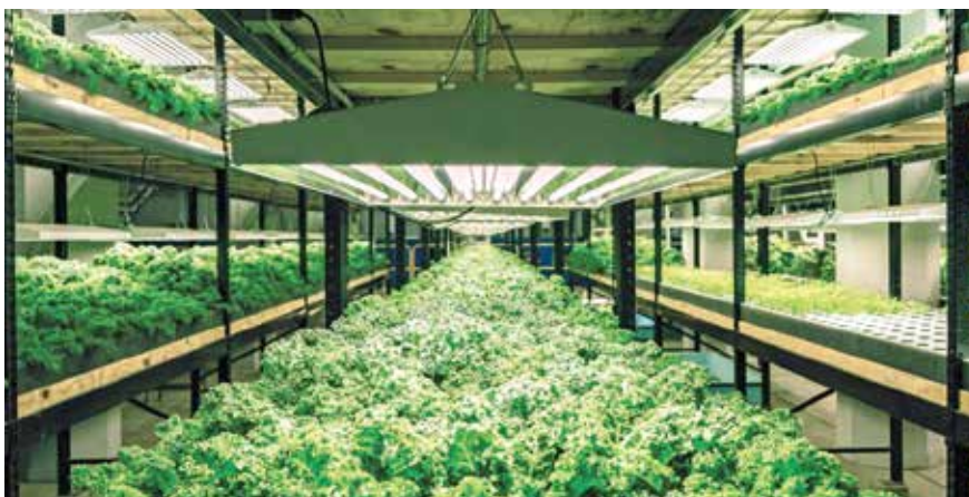
Aquaponianläggning i Australien.

Sverige importerar 25 000 ton odlad fisk per år