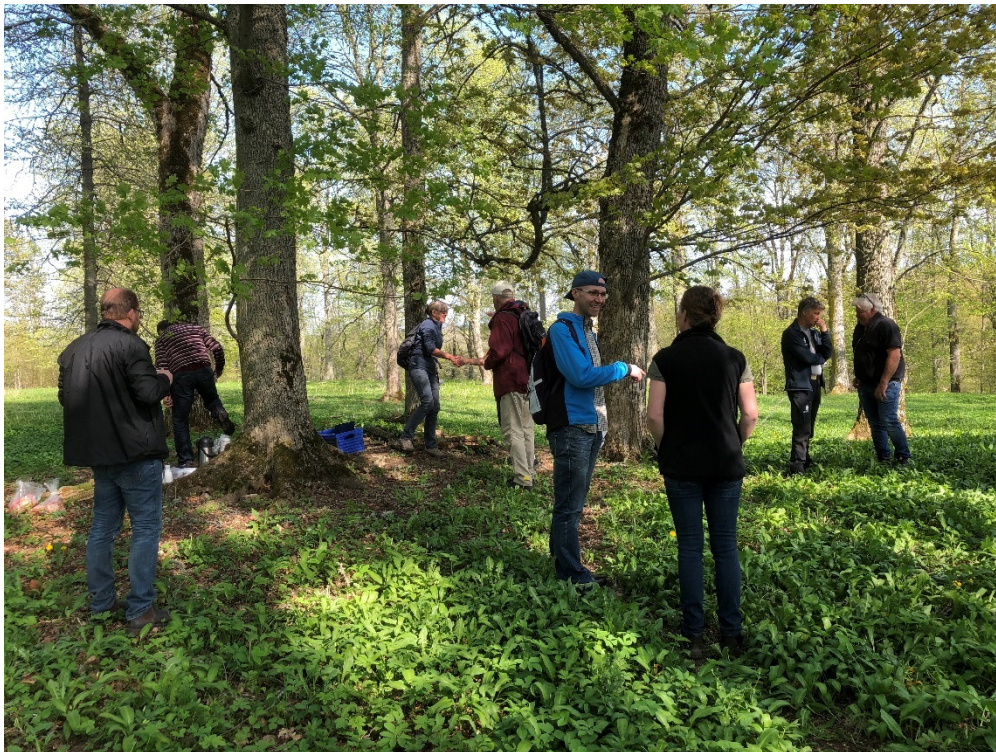
Diskussioner kring skötseln av slottsområdet vid Höjentorp

Målsättningen för denna träff var alltså att i fält diskutera ovanstående frågor.