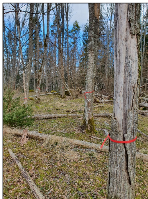
Uppmärkta träd vid Silverfallet som ska åtgärdas