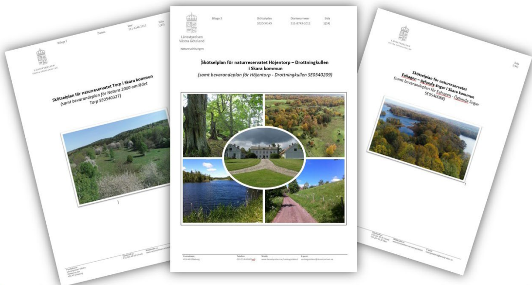
Förslag till skötselplaner för Torp, Höjentorp och Eahagen

Under 2021 har överenskommelse om ersättning nåtts med flera av markägarna i Höjentorp och de sista markägarna i Torp. Det innebär att i Eahagen, Jättadalen och Torp har nu samtliga markägare ersatts för de ingrepp i markanvändningen som de ombildade naturreservaten kommer att innebära. Avtal med återstående markägare i Höjentorp planeras att tecknas under våren 2022. Förslag till beslutsdokument och skötselplan för de 4 reservaten har tagits fram. Det som återstår är att invänta arbetet med åtgärderna 4 och 5 och eventuellt anpassa skötselplanerna efter vad som kommer fram i de diskussionerna.