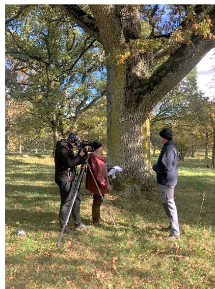
Filminspelning i Valle

Den rapport som samverkansgruppen uppdrog åt Magnus Ljung att sammanställa avseende projektets erfarenheter m.m. från att jobba med samverkan beräknas vara klar i november 2021. BIOGOV ingår också fr.o.m. hösten 2021 i Naturvårdsverkets referensgrupp för att ta fram ett nytt nationellt utbildningspaket "dialog för naturvård". Naturvårdsverket har också spelat in en film i Valle om hur BIOGOVs samarbetsgrupp har tillämpat forskningsresultat från högskolan i Skövde (i detta fall det sk. biotop biodiversitets capacity indicator som samarbetsgruppen använt som kunskapsunderlag i sitt arbete). Sammantaget är det tydligt att projektets arbete har uppmärksamrats nationellt vilket är väldigt roligt!