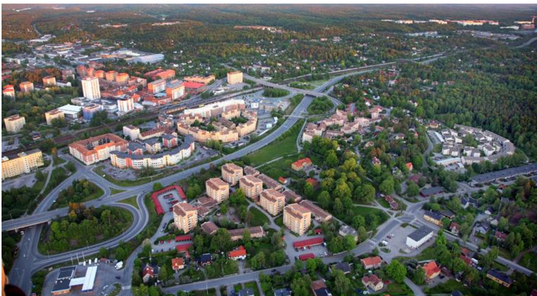
Huddinge kommun, Mostphotos

Antal ärenden och typ av tillsynsärenden varierar från kommun till kommun. Ett medskick från Huddinge kommun är att det är viktigt att utgå från kommunens egna behov och statistik när en tillsynsplan ska upprättas.