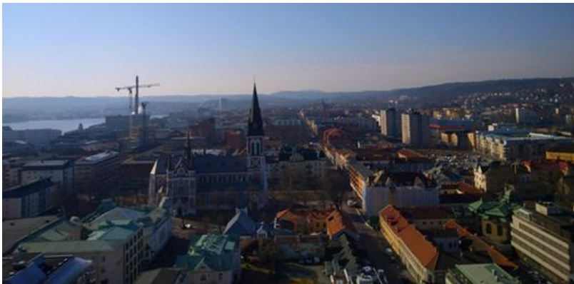
Bild över Jönköping

Arbetet med upprättandet av tillsynsplanen påbörjades under 2021, initierat av bygglovschefen på Jönköpings kommun. Stadsbyggnadsnämnden beslutade i verksamhetsplanen att ta fram en tillsynsplan. Detta är den första tillsynsplanen som ligger till grund för tillsynsarbetet i kommunen utifrån plan- och bygglagen (2010:900). Ändamålet med tillsynsplanen är att fastställa de årliga målen för tillsynen samt att redovisa metoderna för att uppnå målen genom tillsynen. Målet med att bedriva tillsynsarbetet utifrån en tillsynsplan är också att skapa tydlighet mellan stadsbyggnadsnämnden, förvaltningen och medborgarna. Genom en tillsynsplan som dokument lyfts tillsynsarbetet fram i förvaltningens och avdelningens dagliga arbete. Planen bidrar också till ökad rättssäkerhet, tydlighet, transparens och struktur i arbetet.