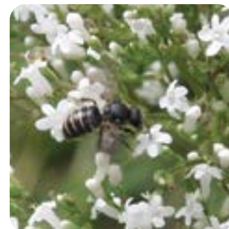
▲ Solitärbin finns i många olika storlekar och former.

Ihåligheterna måste inte ligga horisontellt, de kan vara i vilken vinkel som helst. Märgen i hallonskott behöver du inte peta ut, bina använder den till mellanväggar. Alla rör i samma bunt måste inte ha samma diameter, olika arter bor gärna gran-