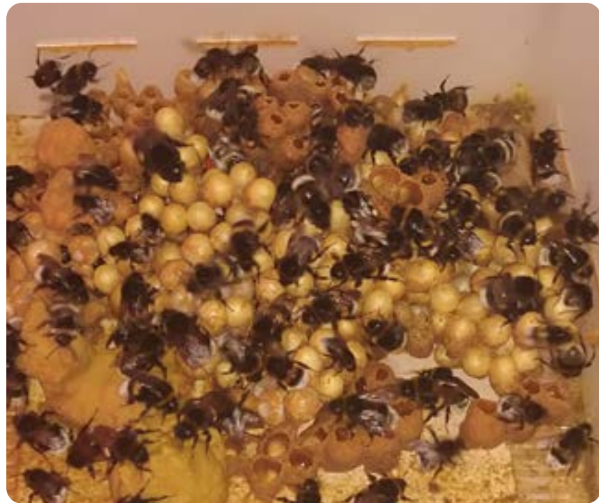
▲ Mörka, svenska jordhumlor, förökade i produktionslokalen i Östergötland.

Produktionshumlor behövs i stora odlingar där det inte finns tillräckligt med vilda pollinatörer. Olika arter av pollinerare är specialister på olika typer av grödor. Till exempel kan tomater enbart pollineras av humlor. Om vi jämför humlor och honungsbin, så pollinerar humlor vid lägre temperatur och vid sämre väder. Därför är de lämpligt att