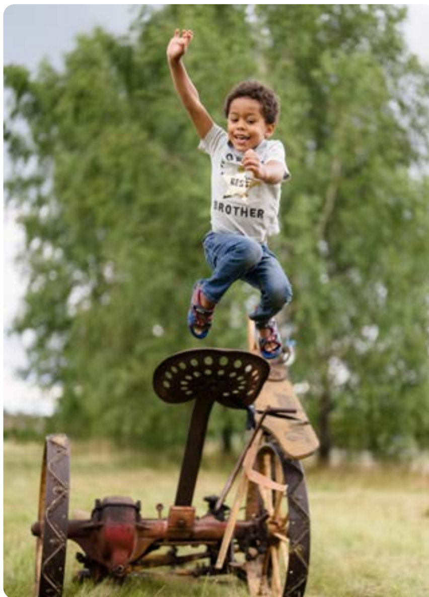
▲ Både äldre och yngre förbipasserande uppskattar inslaget med hästslätter i stan.