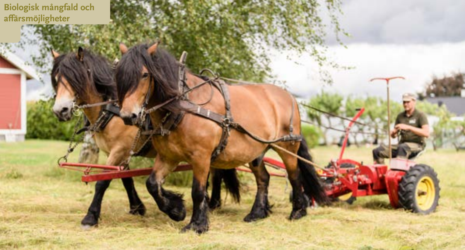
▲ Tora och Frej drar slättermaskinen med Per Madestam bakom tömmarna.