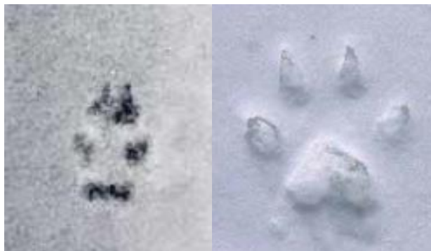
Figur 4: Olika vargspår. Framtass.

En indikation på att man ser ett vargspår kan man få av storleken. Ett normalstort svenskt vargspår är 10cm eller större. Man mäter då från mellanfotsdynans bakre kant till tådynans främre, alltså utan klor. Vargar förflyttar sig ofta i trav och rör sig målmedvetet. Vanligtvis är steglängden, från fot till samma fot runt 150cm på en varg i trav. Detta kan ge en bättre indikation på att det är varg man ser spår av än storleken på spårstämpeln då inte