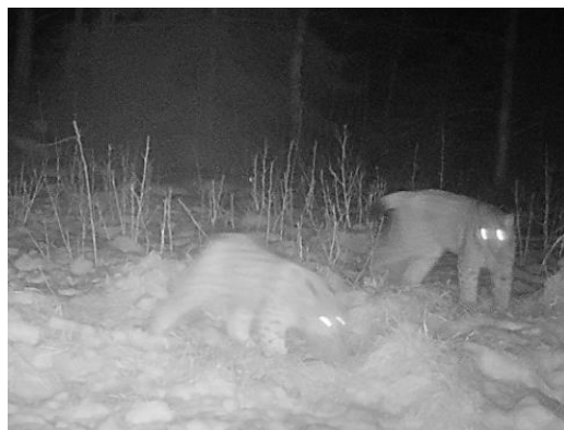
Figur 2: Lodjurshona med unge.

För lodjurens del kan Länsstyrelsen även använda privata bilder från åtelkameror samt övervakningskameror vilket vi gärna gör!