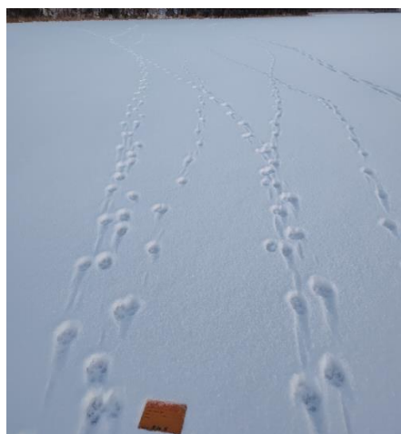
Figur 1: Spårning av 6 vargar i Ösjöreviret.

Under licensjakten har hittills fyra vargar skjutits inom jaktområdet i Grytenreviret. DNA prover har bekräftat att alla dessa tillhört Grytenreviret. Två vargar återstår därmed på tilldelningen och jakten pågår till och med 15 februari, eller till dess att Länsstyrelsen avlyser jakten. Då snön ser ut att kunna återkomma innan jakten avslutas ger det jägarna goda förutsättningar i jaktområdet.